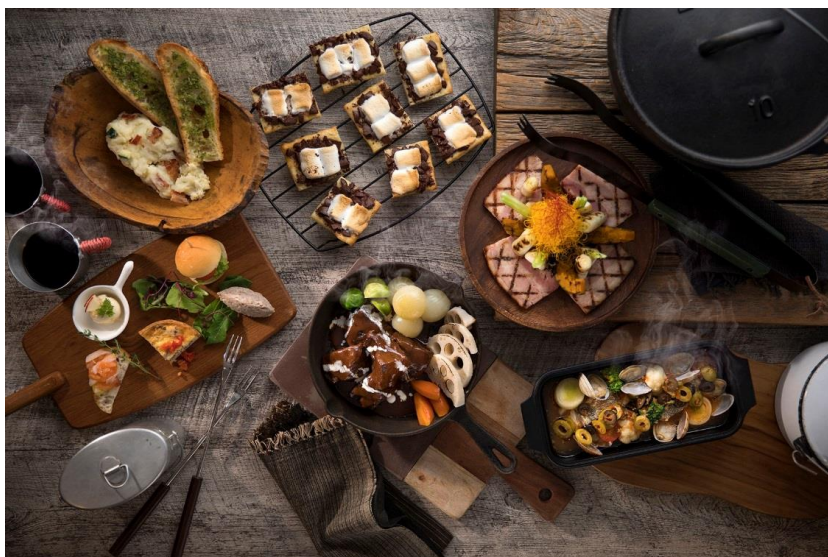
WINTER DINNER COURSE イメージ