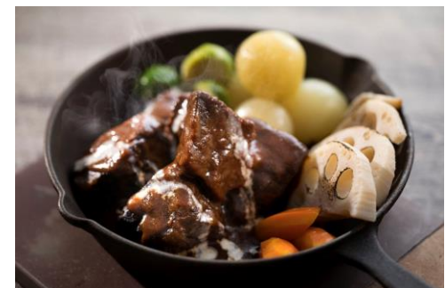
牛ホホ肉の赤ワイン煮込