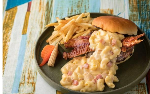
マッケンチーズバーガーイメージ

アメリカのキャンプ料理の定番「マッケンチーズ（マカロニ・アンド・チーズ）」を、バーガーにトッピングした、身もこころも温まる一品です。軽くグリルしたバンズに、チェダーチーズを絡めたマカロニと、国産牛100%のボリュームミーなパテをサンド。濃厚な味わいながら、クリスピーベーコンの塩気と食感がアクセントとなり、最後まで飽きずにお召し上がりいただけます。