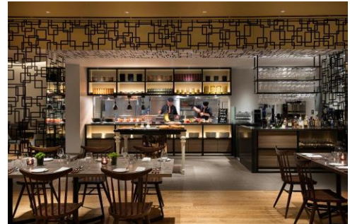
Dining & Bar LAVAROCK

◆本件に関するお客様からのご予約・お問い合わせ先◆ コートヤード・バイ・マリオット新大阪ステーション Dining & Bar LAVAROCK (ダイニング & バー ラヴァロック) ご予約・お問い合わせ TEL.06-6350-5701