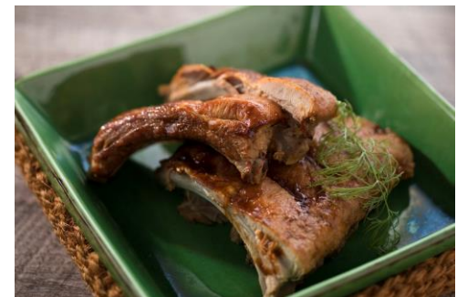
BBQベビーバックリブ