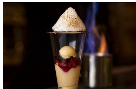
Parfait d'Alaska for Valentine イメージ

照明を落とした店内に煌めく炎が映える「パフェ・ド・アラスカ」。グラスにカスタード、ベリーソース、アイスクリームを重ね、チョコレートプレートとメレンゲで蓋をしました。カルヴァドスの芳醇な香りが引き立つパフェとともに、甘く幸せな時間をお楽しみください。