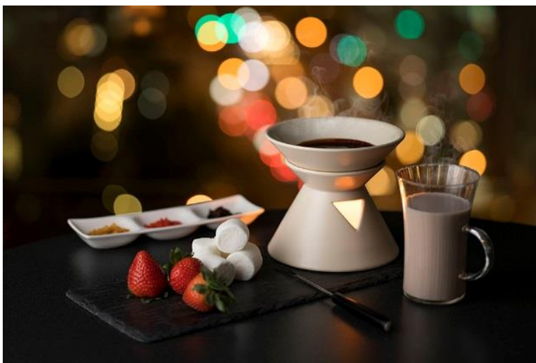
Valentine Cocktail イメージ