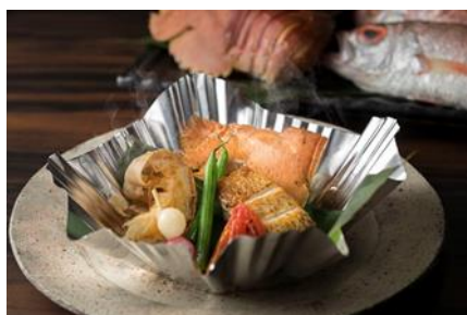
長崎県で水揚げされた海の幸 うちわ海老とあかむつの蒸し焼き 焼きトマト、かんざらし、島原海苔のソース