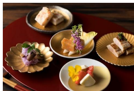
一花一葉オリジナル卓袱料理イメージ