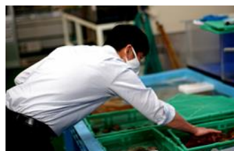
※平戸市・平戸瀬戸市場