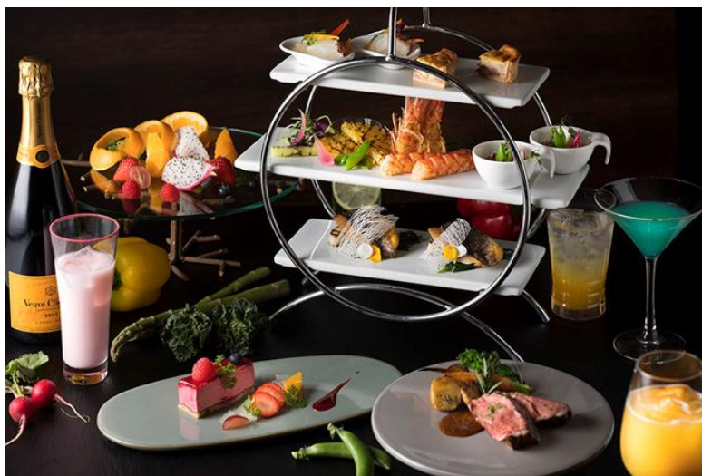
Evening High Tea-Spring-イメージ