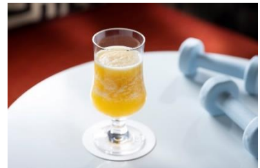
オリジナルドリンクイメージ

フルーツをベースにしたスムージーを運動後にご用意いたします。Dining & Bar LAVAROCK または、お部屋にてお楽しみいただけます。