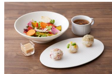
ファスティング食 イメージ

夕食は、素材を活かしたシェフメイドのファスティング食をご用意。朝食には、約60種類のハーブや野菜、果物を発酵熟成させ、酵素を効率的に摂取できるカウンセリング専売の酵素ドリンク「KALA」またはホテルメイドのスムージーをお部屋にお届けいたします。