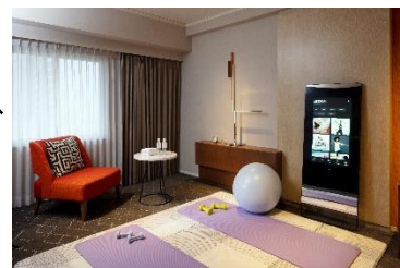
MIRROR FIT. ルーム イメージ

お部屋には、次世代型スマートミラー「MIRROR FIT.」を設置しています。MIRROR FIT.は、専用のミラーデバイスと専用アプリによって、お部屋に居ながらにしてプロが監修した400種類以上の本格的なトレーニングコンテンツを楽しむことが出来る、次世代型スマートミラーです。MIRROR FIT.以外にもヨガマットやバランスボールなどをご用意しており、またファスティングにあったプログラムをファスティングの専門家をご提案いたします。