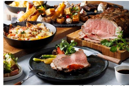
ディナーイメージ

ディナータイムは、ランチタイムのセミbuffeの料理に加え、さらにお楽しみいただける品数をご用意。さらにローストビーフ食べ放題もございます。小学生以下のお子様のメインディッシュには、ハンバーグと海老フライ プレートをご提供いたします。