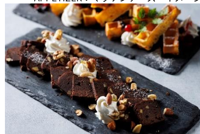
DESSERT：チョコレートブラウニー イメージ